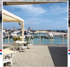
il Porto Turistico di Termoli